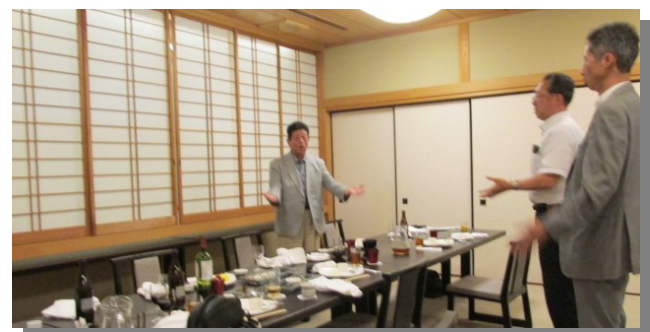
新座ロータリークラブの益々の発展と会員皆様のご健康を祈念致しまして一本締めでお願いします