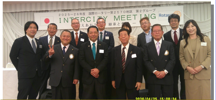
新座・新座こぶしロータリークラブ会員の皆様