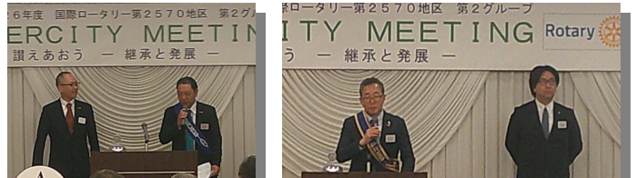
幹事より古賀新入会員紹介 会長より次年度会長幹事紹介